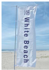
▲目印のホワイトビーチのぼり旗