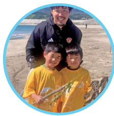
▲「ベガルタ仙台」オリジナルTシャツ