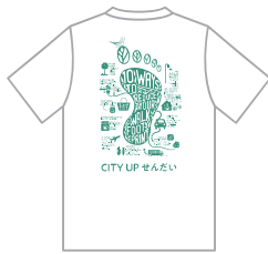
▲「CITY UP せんだい」オリジナルTシャツ